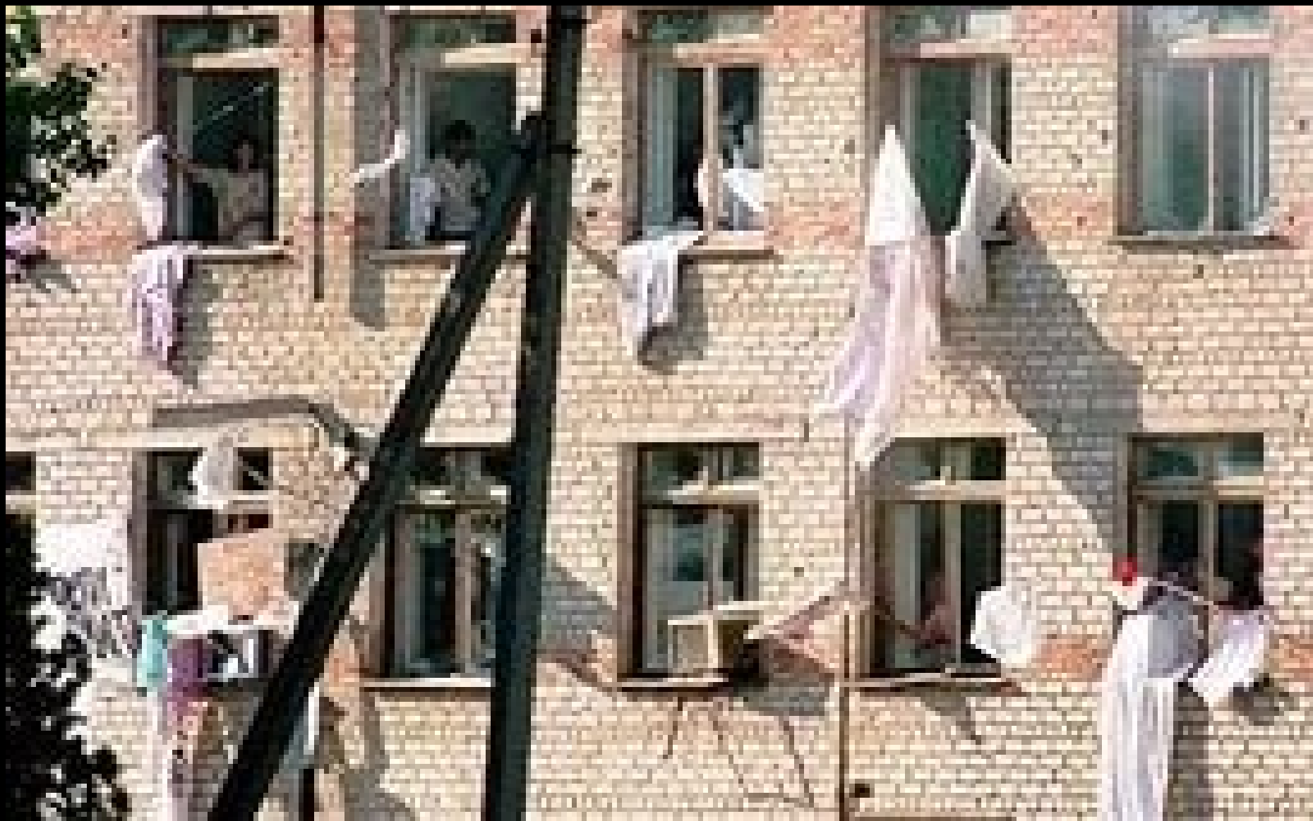
Больница в Буденновске